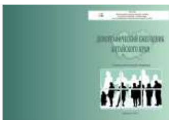
Демографический ежегодник Алтайского края

Все сборники выполнены в цветном изображении, для наглядной характеристики широко использованы графические материалы, диаграммы, схемы, облегчающие восприятие статистических данных пользователям различного круга, приведены методологические комментарии.